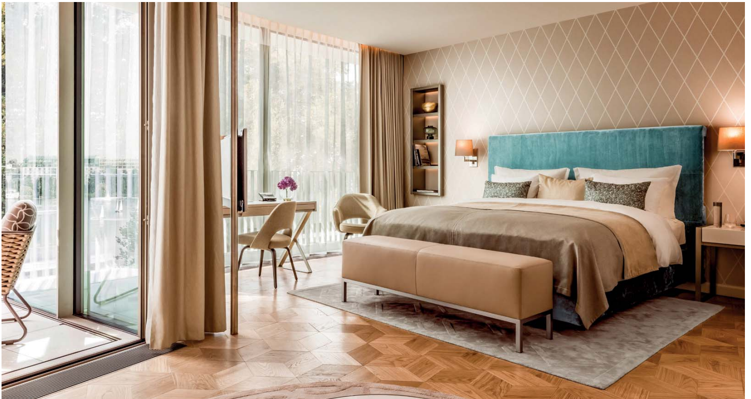
Fotografie The Fontenay Hamburg